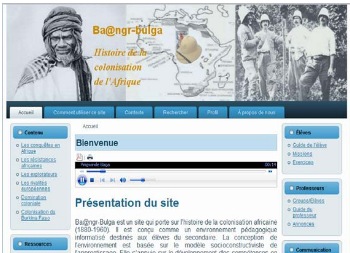
Figure 6 : Page d'accueil du site web

La réalité sociale de la colonisation a été abordée sous l'angle d'entrée suivant : comment les territoires africains sont-ils devenus des colonies européennes? Cette interrogation sert de balise de contenu et invite à aborder le thème de la colonisation sous un triple aspect :